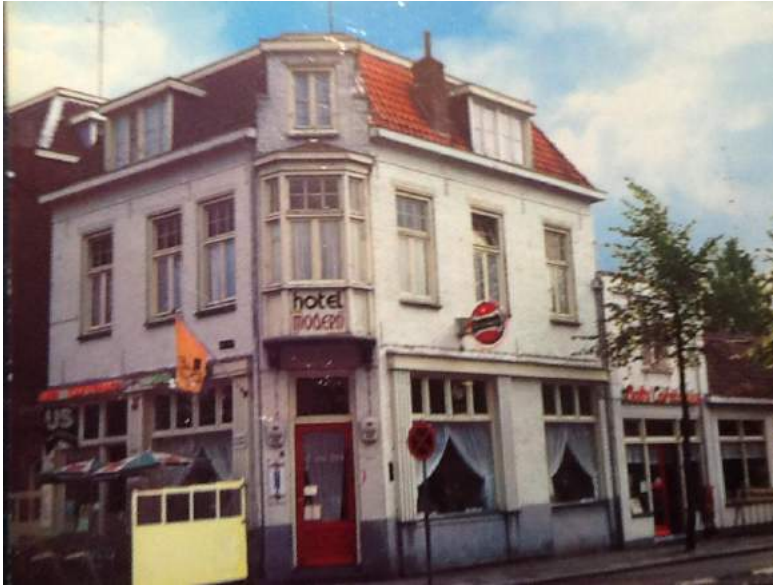
foto 10 Hotel Modern