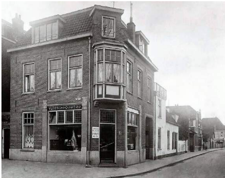
foto 9 Slagerij Van Oss