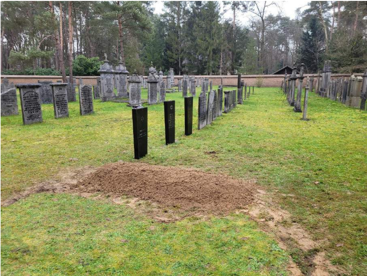
foto 13 Graf van Marijke Wagenaar-van Oss naast de graven van haar ouders en haar oom